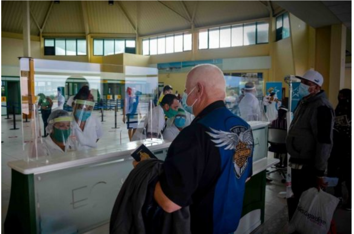
An sämtlichen Flughäfen Kubas gelten strenge Hygienevorschriften, wie hier in Holguín