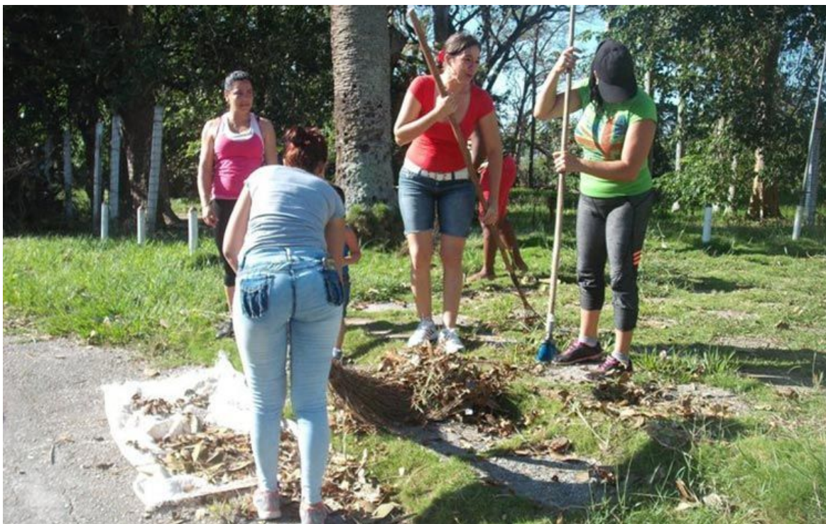
Aufräumarbeiten nach „Irma“ auf Kuba

übrigen Hotels sowie der Flughafen auf der nördlichen Inselkette „Jardines del Rey“ folgen.